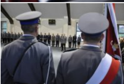
Ślubowanie policjantów 04.01.2018 #33