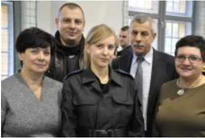
Ślubowanie policjantów 04.01.2018 #55