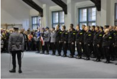
Ślubowanie policjantów 04.01.2018 #2