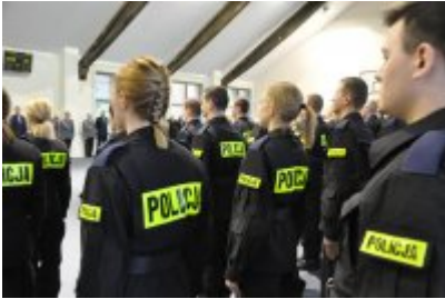
Ślubowanie policjantów 04.01.2018 #10