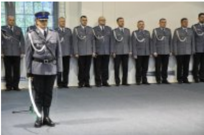
Ślubowanie policjantów 04.01.2018 #5