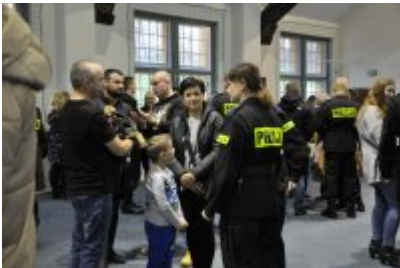
Ślubowanie policjantów 04.01.2018 #54