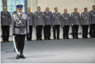
Ślubowanie policjantów 04.01.2018 #5