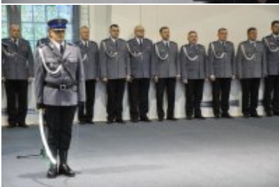
Ślubowanie policjantów 04.01.2018 #5