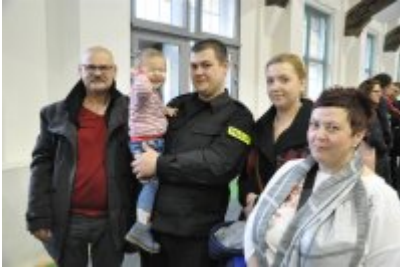
Ślubowanie policjantów 04.01.2018 #53