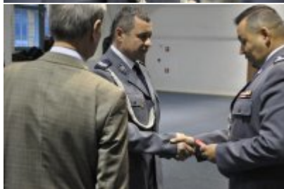
Ślubowanie policjantów 04.01.2018 #30

Zgodnie z obowiązującymi przepisami służbę w policji może pełnić: