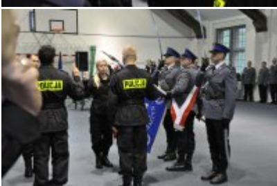
Ślubowanie policjantów 04.01.2018 #15