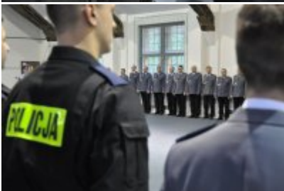
Ślubowanie policjantów 04.01.2018 #44