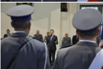
Ślubowanie policjantów 04.01.2018 #40