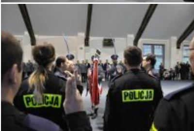
Ślubowanie policjantów 04.01.2018 #14