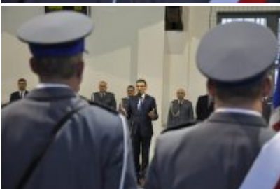
Ślubowanie policjantów 04.01.2018 #40