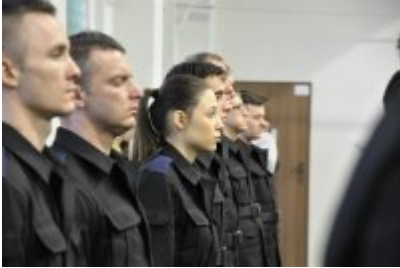
Ślubowanie policjantów 04.01.2018 #42