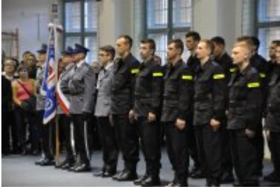
Ślubowanie policjantów 04.01.2018 #9