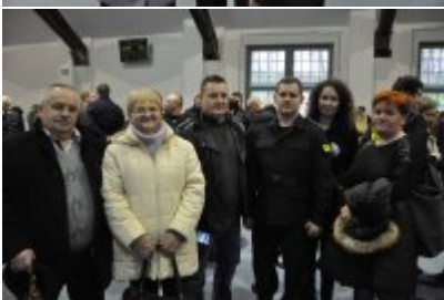
Ślubowanie policjantów 04.01.2018 #52