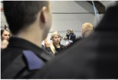
Ślubowanie policjantów 04.01.2018 #16