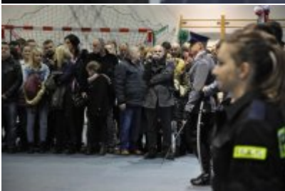
Ślubowanie policjantów 04.01.2018 #45