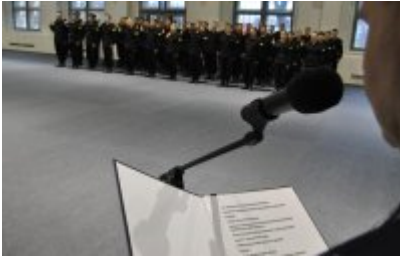
Ślubowanie policjantów 04.01.2018 #61

Nowi policjanci wkrótce rozpoczną służbę w Oddziale Prewencji Policji w Olsztynie (8 osób), w Komendzie Miejskiej Policji w Olsztynie (17 osób), w Komendzie Miejskiej Policji w Elblągu (4 osoby), w jednostkach powiatowych policji w Ostródzie (4 osoby), Działdowie (3 osoby), Szczytnie (3 osoby), Bartoszycach (2 osoby), Pisz (2 osoby) oraz w Braniewie, Ełku, Lidzbarku Warmińskim, Nidzicy Nowym Mieście Lubawskim i Olecku (po jednej osobie). Zanim jednak wszyscy oni wyjdą na swój pierwszy patrol, przejdą szkolenie podstawowe w Wyższej Szkole Policji w Szczytnie.