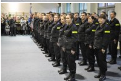
Ślubowanie policjantów 04.01.2018 #6