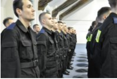
Ślubowanie policjantów 04.01.2018 #43