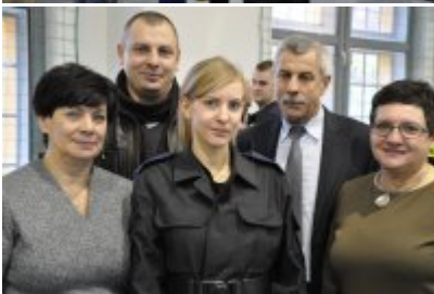
Ślubowanie policjantów 04.01.2018 #55