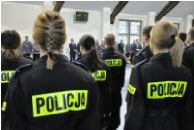
Ślubowanie policjantów 04.01.2018 #46