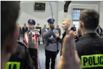
Ślubowanie policjantów 04.01.2018 #18