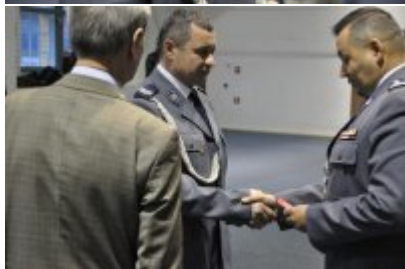
Ślubowanie policjantów 04.01.2018 #30

Zgodnie z obowiązującymi przepisami służbę w policji może pełnić: