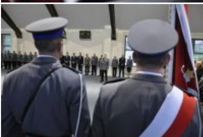
Ślubowanie policjantów 04.01.2018 #33