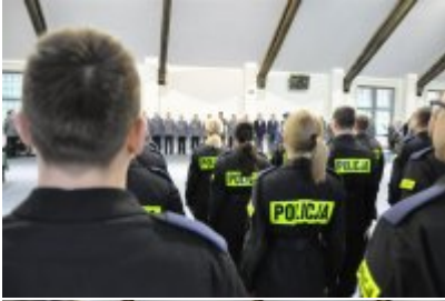
Ślubowanie policjantów 04.01.2018 #59