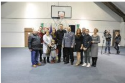
Ślubowanie policjantów 04.01.2018 #48

W uroczystości ślubowania wzięli udział najbliżsi nowo przyjętych policjantów. Rodzice, małżonkowie albo dzieci po raz pierwszy mogli zobaczyć swoich bliskich w nowej roli, w mundurach. Wielu z nich było przejętych i dumnych. Pojawiły się łzy wzruszenia i gratulacje.