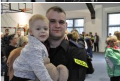
Ślubowanie policjantów 04.01.2018 #57