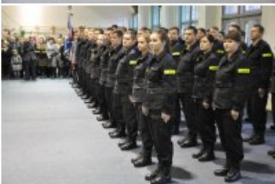
Ślubowanie policjantów 04.01.2018 #6