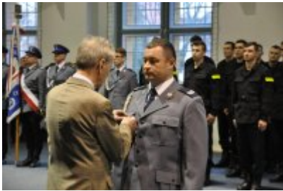
Ślubowanie policjantów 04.01.2018 #27