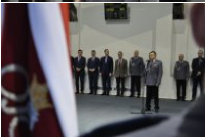
Ślubowanie policjantów 04.01.2018 #32