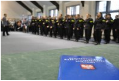
Ślubowanie policjantów 04.01.2018 #23