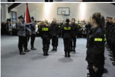
Ślubowanie policjantów 04.01.2018 #21