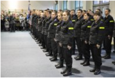
Ślubowanie policjantów 04.01.2018 #6