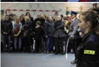
Ślubowanie policjantów 04.01.2018 #34