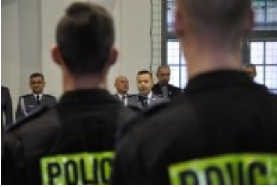
Ślubowanie policjantów 04.01.2018 #35