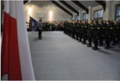
Ślubowanie policjantów 04.01.2018 #24