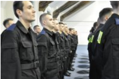
Ślubowanie policjantów 04.01.2018 #43