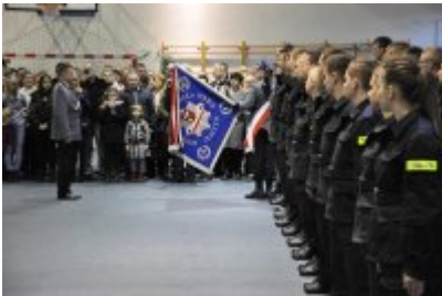
Ślubowanie policjantów 04.01.2018 #4