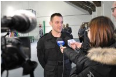
Ślubowanie policjantów 04.01.2018 #56