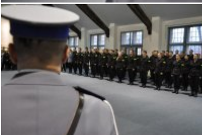
Ślubowanie policjantów 04.01.2018 #8