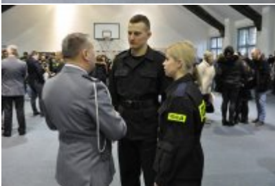
Ślubowanie policjantów 04.01.2018 #49