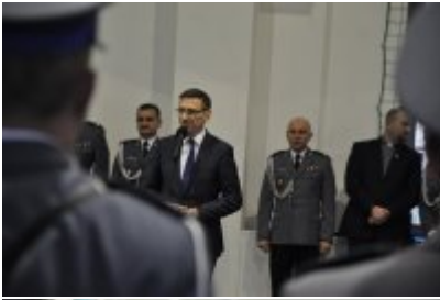
Ślubowanie policjantów 04.01.2018 #41