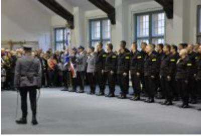
Ślubowanie policjantów 04.01.2018 #2