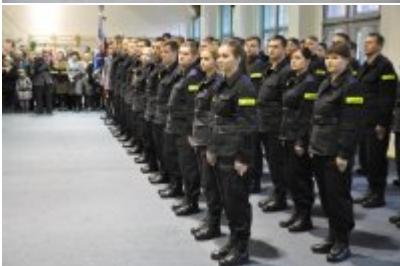
Ślubowanie policjantów 04.01.2018 #6