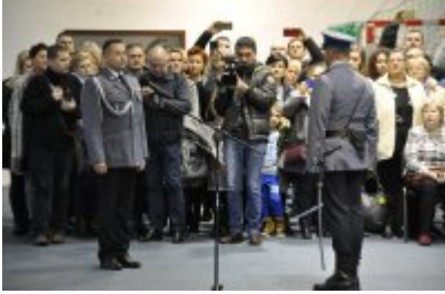
Ślubowanie policjantów 04.01.2018 #3