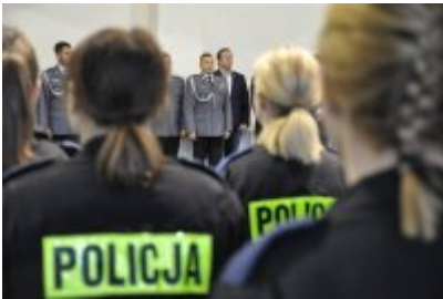
Ślubowanie policjantów 04.01.2018 #25