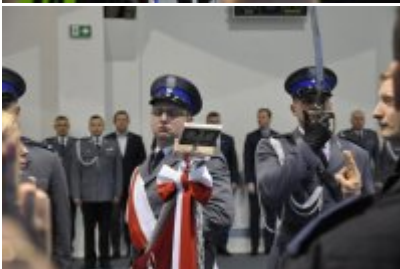
Ślubowanie policjantów 04.01.2018 #19