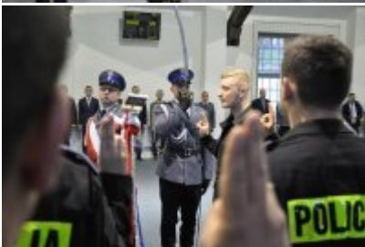
Ślubowanie policjantów 04.01.2018 #18