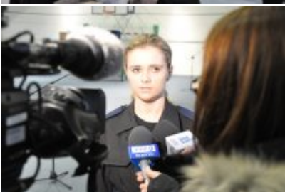
Ślubowanie policjantów 04.01.2018 #58