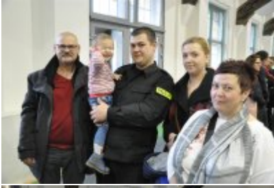
Ślubowanie policjantów 04.01.2018 #53