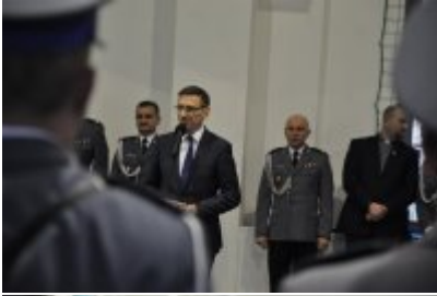
Ślubowanie policjantów 04.01.2018 #41