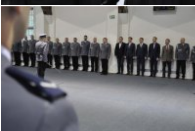
Ślubowanie policjantów 04.01.2018 #47