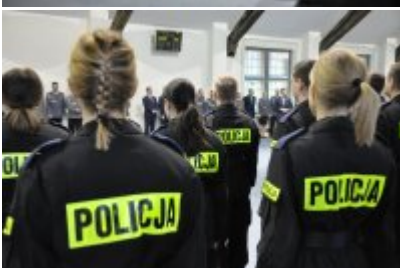
Ślubowanie policjantów 04.01.2018 #46