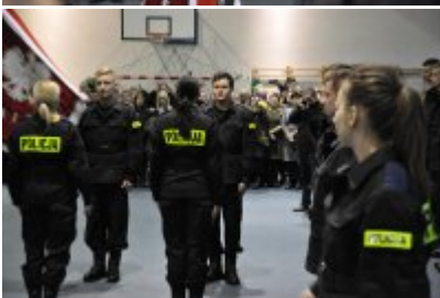
Ślubowanie policjantów 04.01.2018 #20