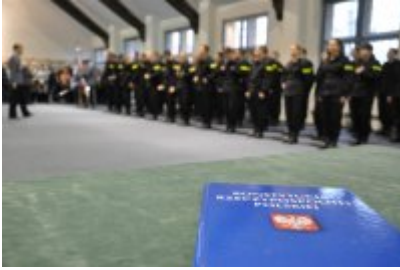
Ślubowanie policjantów 04.01.2018 #23