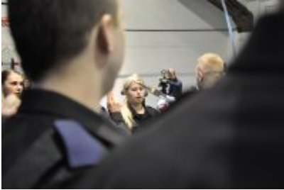
Ślubowanie policjantów 04.01.2018 #16