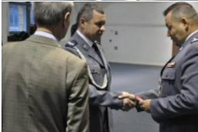
Ślubowanie policjantów 04.01.2018 #30

Zgodnie z obowiązującymi przepisami służbę w policji może pełnić: