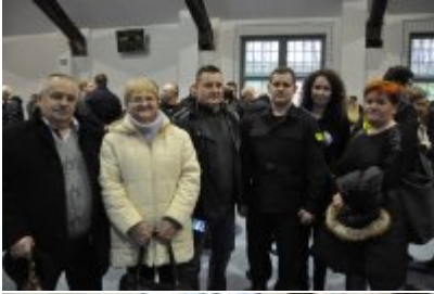
Ślubowanie policjantów 04.01.2018 #52