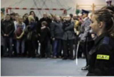
Ślubowanie policjantów 04.01.2018 #34