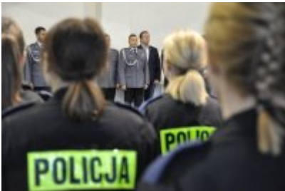
Ślubowanie policjantów 04.01.2018 #25