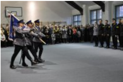
Ślubowanie policjantów 04.01.2018 #11