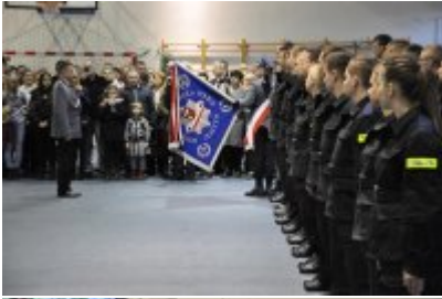
Ślubowanie policjantów 04.01.2018 #4