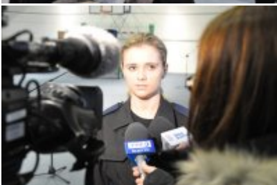
Ślubowanie policjantów 04.01.2018 #58