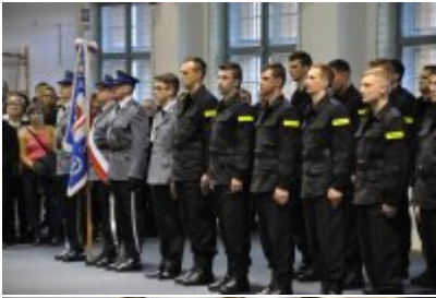
Ślubowanie policjantów 04.01.2018 #9