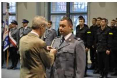
Ślubowanie policjantów 04.01.2018 #27