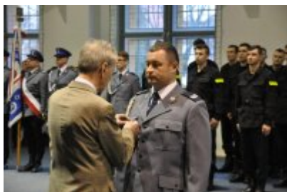
Ślubowanie policjantów 04.01.2018 #27