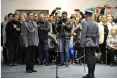
Ślubowanie policjantów 04.01.2018 #3