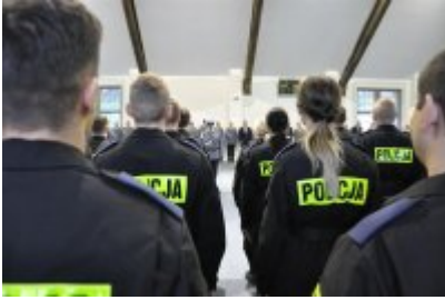
Ślubowanie policjantów 04.01.2018 #60