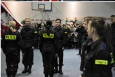
Ślubowanie policjantów 04.01.2018 #20