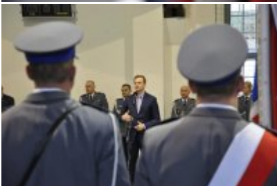
Ślubowanie policjantów 04.01.2018 #39