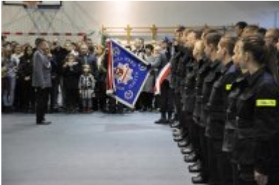
Ślubowanie policjantów 04.01.2018 #4