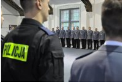
Ślubowanie policjantów 04.01.2018 #44