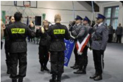
Ślubowanie policjantów 04.01.2018 #17