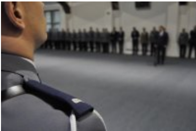
Ślubowanie policjantów 04.01.2018 #37