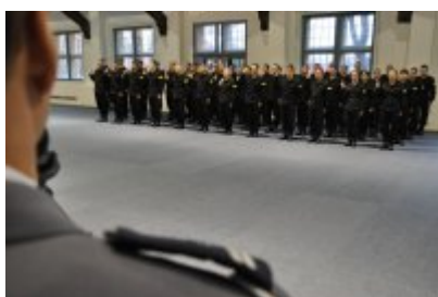
Ślubowanie policjantów 04.01.2018 #1