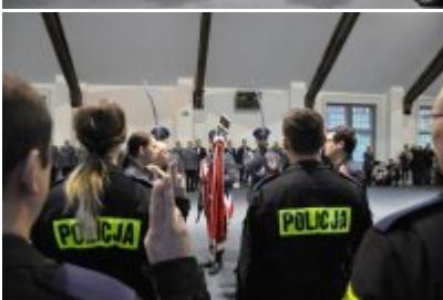
Ślubowanie policjantów 04.01.2018 #14