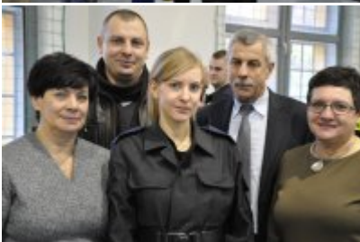
Ślubowanie policjantów 04.01.2018 #55