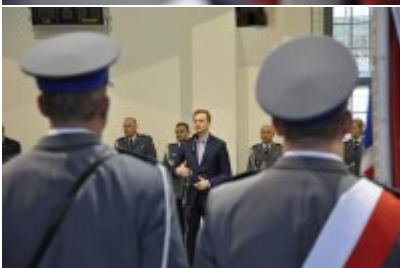
Ślubowanie policjantów 04.01.2018 #39