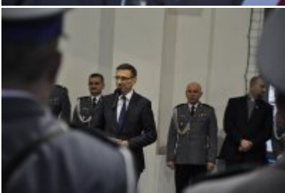
Ślubowanie policjantów 04.01.2018 #41