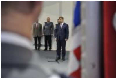
Ślubowanie policjantów 04.01.2018 #38