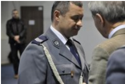
Ślubowanie policjantów 04.01.2018 #29