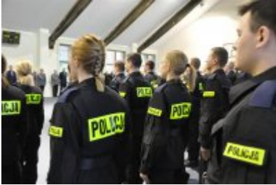
Ślubowanie policjantów 04.01.2018 #10