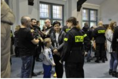
Ślubowanie policjantów 04.01.2018 #54