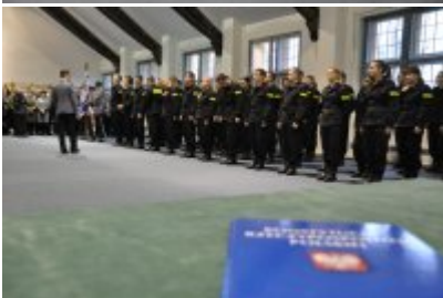
Ślubowanie policjantów 04.01.2018 #12