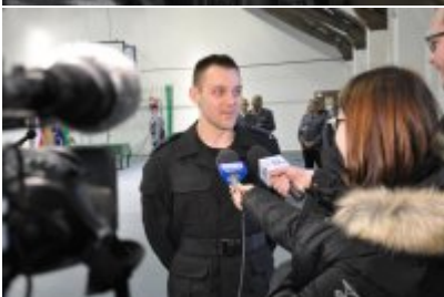
Ślubowanie policjantów 04.01.2018 #56