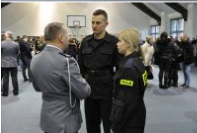
Ślubowanie policjantów 04.01.2018 #49