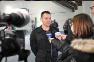
Ślubowanie policjantów 04.01.2018 #56