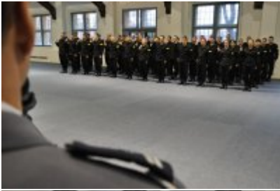
Ślubowanie policjantów 04.01.2018 #1