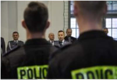
Ślubowanie policjantów 04.01.2018 #35