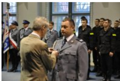
Ślubowanie policjantów 04.01.2018 #27