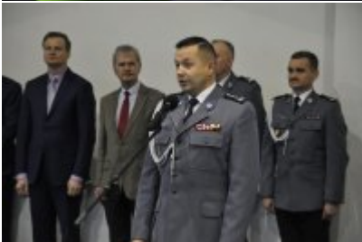
Ślubowanie policjantów 04.01.2018 #31