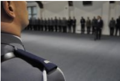
Ślubowanie policjantów 04.01.2018 #37