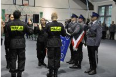
Ślubowanie policjantów 04.01.2018 #17