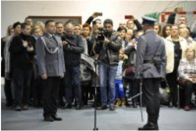
Ślubowanie policjantów 04.01.2018 #3