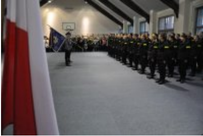
Ślubowanie policjantów 04.01.2018 #24