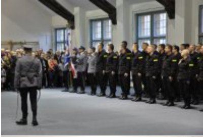
Ślubowanie policjantów 04.01.2018 #2