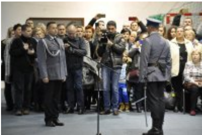
Ślubowanie policjantów 04.01.2018 #3