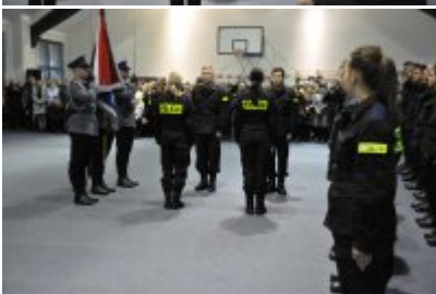
Ślubowanie policjantów 04.01.2018 #21