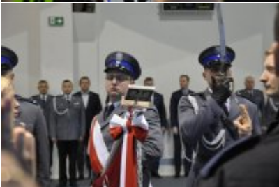
Ślubowanie policjantów 04.01.2018 #19