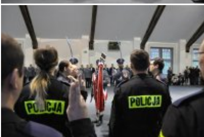
Ślubowanie policjantów 04.01.2018 #14