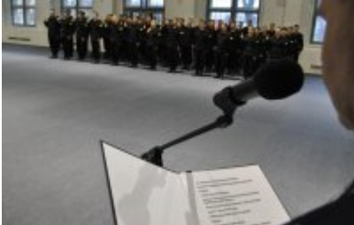
Ślubowanie policjantów 04.01.2018 #61

Nowi policjanci wkrótce rozpoczną służbę w Oddziale Prewencji Policji w Olsztynie (8 osób), w Komendzie Miejskiej Policji w Olsztynie (17 osób), w Komendzie Miejskiej Policji w Elblągu (4 osoby), w jednostkach powiatowych policji w Ostródzie (4 osoby), Działdowie (3 osoby), Szczytnie (3 osoby), Bartoszycach (2 osoby), Pisz (2 osoby) oraz w Braniewie, Ełku, Lidzbarku Warmińskim, Nidzicy Nowym Mieście Lubawskim i Olecku (po jednej osobie). Zanim jednak wszyscy oni wyjdą na swój pierwszy patrol, przejdą szkolenie podstawowe w Wyższej Szkole Policji w Szczytnie.