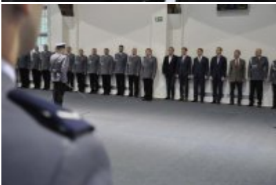
Ślubowanie policjantów 04.01.2018 #47