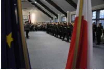
Ślubowanie policjantów 04.01.2018 #22