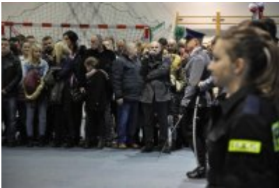
Ślubowanie policjantów 04.01.2018 #45