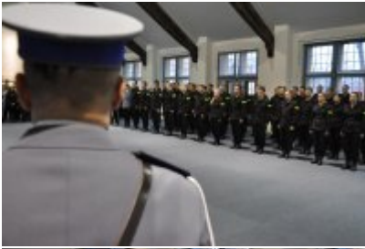
Ślubowanie policjantów 04.01.2018 #8