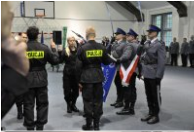
Ślubowanie policjantów 04.01.2018 #15