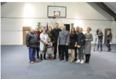
Ślubowanie policjantów 04.01.2018 #48

W uroczystości ślubowania wzięli udział najbliżsi nowo przyjętych policjantów. Rodzice, małżonkowie albo dzieci po raz pierwszy mogli zobaczyć swoich bliskich w nowej roli, w mundurach. Wielu z nich było przejętych i dumnych. Pojawiły się łzy wzruszenia i gratulacje.