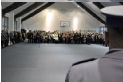
Ślubowanie policjantów 04.01.2018 #7