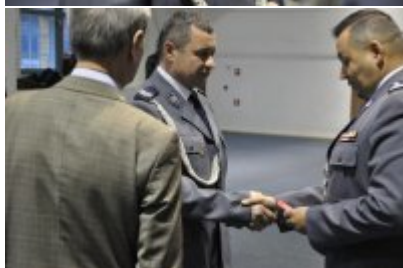
Ślubowanie policjantów 04.01.2018 #30

Zgodnie z obowiązującymi przepisami służbę w policji może pełnić: