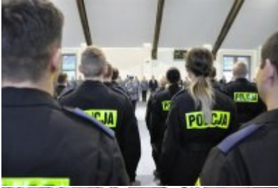
Ślubowanie policjantów 04.01.2018 #60