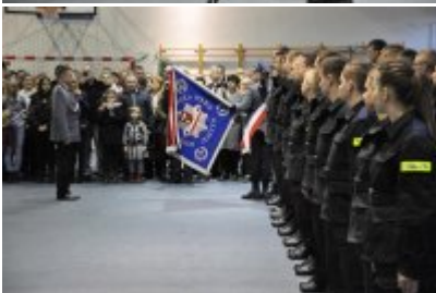
Ślubowanie policjantów 04.01.2018 #4