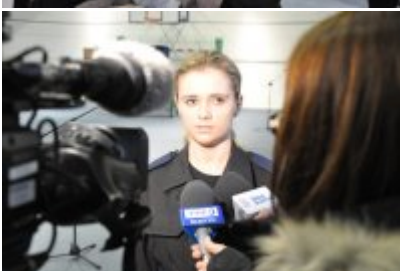
Ślubowanie policjantów 04.01.2018 #58