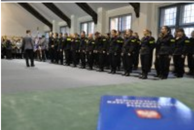
Ślubowanie policjantów 04.01.2018 #12