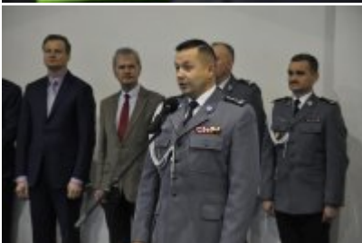
Ślubowanie policjantów 04.01.2018 #31