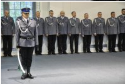
Ślubowanie policjantów 04.01.2018 #5