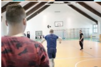
Dzien Kandydata - 17.03.2018 #24