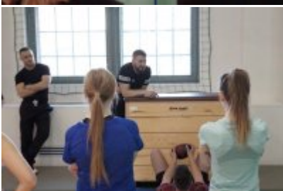
Dzien Kandydata - 17.03.2018 #19