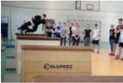
Dzien Kandydata - 17.03.2018 #6