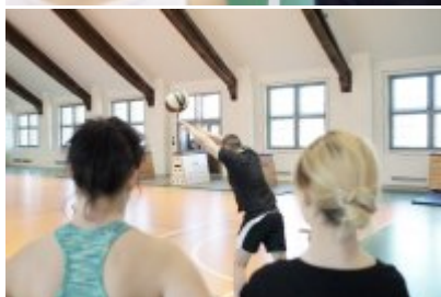
Dzien Kandydata - 17.03.2018 #23