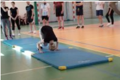
Dzien Kandydata - 17.03.2018 #16