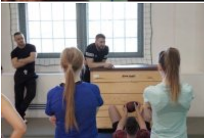
Dzien Kandydata - 17.03.2018 #19