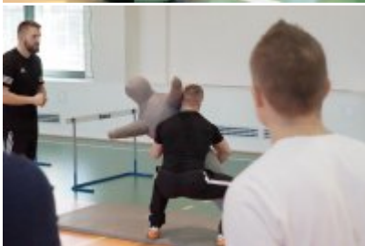
Dzien Kandydata - 17.03.2018 #12