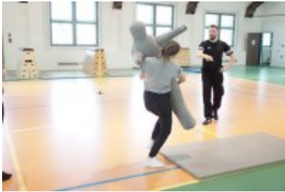
Dzien Kandydata - 17.03.2018 #7