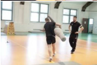
Dzien Kandydata - 17.03.2018 #9