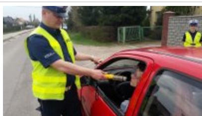
Działania "Alkohol i narkotyki" w Nidzicy #2