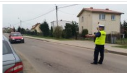
Działania "Alkohol i narkotyki" w Nidzicy #1