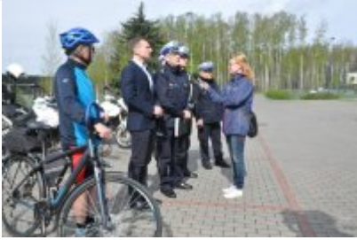
Działania "Jednoślądem bezpiecznie do celu" #10