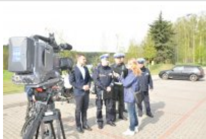
Działania "Jednoślądem bezpiecznie do celu" #2