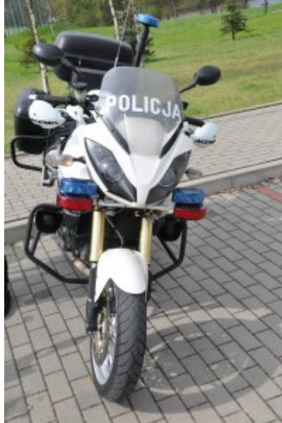
Działania "Jednoślądem bezpiecznie do celu" #11