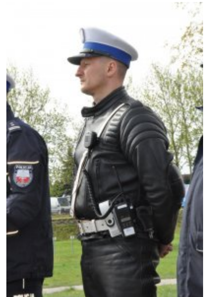
Działania "Jednoślądem bezpiecznie do celu" #6