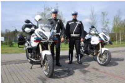
Działania "Jednoślądem bezpiecznie do celu" #13