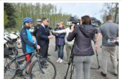
Działania "Jednoślądem bezpiecznie do celu" #9