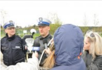
Działania "Jednoślądem bezpiecznie do celu" #7