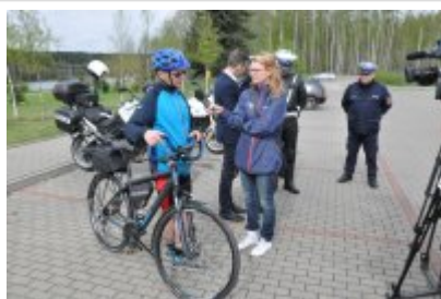
Działania "Jednoślądem bezpiecznie do celu" #8