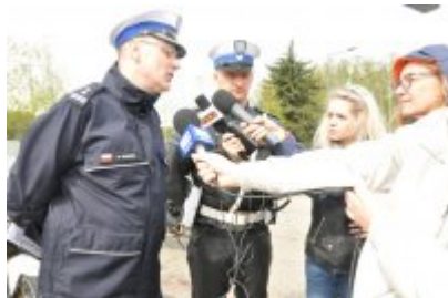
Działania "Jednoślądem bezpiecznie do celu" #5