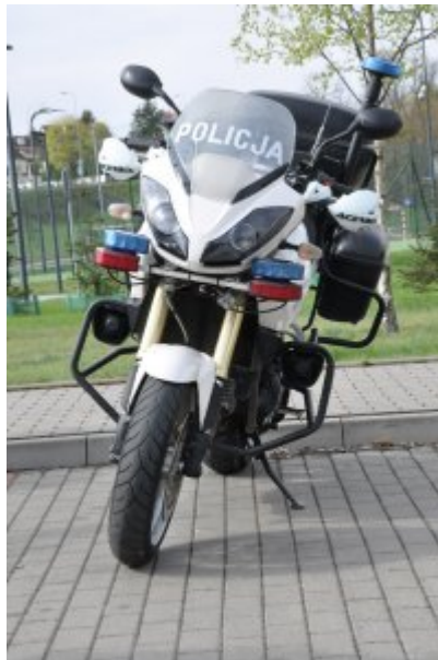
Działania "Jednoślądem bezpiecznie do celu" #14