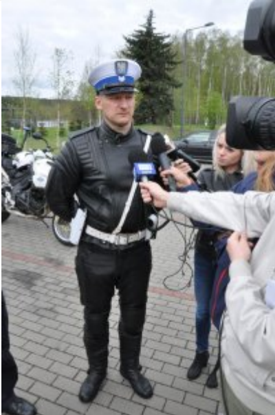
Działania "Jednoślądem bezpiecznie do celu" #1