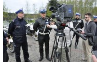
Działania "Jednoślądem bezpiecznie do celu" #12