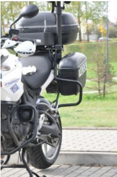
Działania "Jednoślądem bezpiecznie do celu" #4