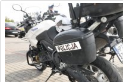
Działania "Jednoślądem bezpiecznie do celu" #3