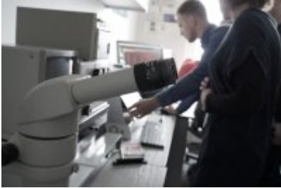
Studenci WSPol podczas wizyty w LK KWP w Olsztynie #12