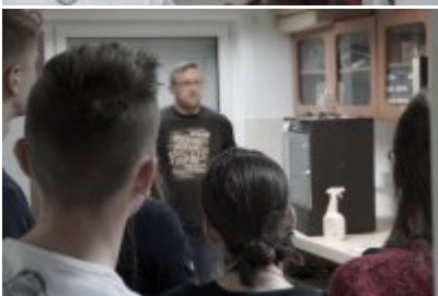
Studenci WSPol podczas wizyty w LK KWP w Olsztynie #16