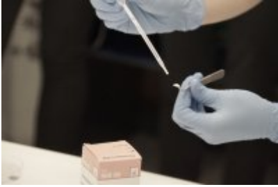
Studenci WSPol podczas wizyty w LK KWP w Olsztynie #19