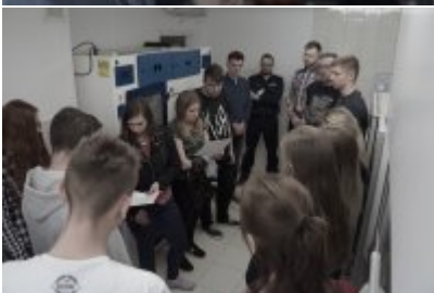
Studenci WSPol podczas wizyty w LK KWP w Olsztynie #15