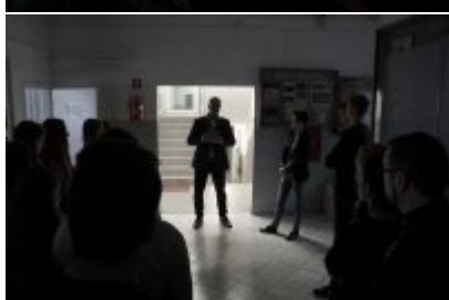
Studenci WSPol podczas wizyty w LK KWP w Olsztynie #10