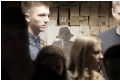
Studenci WSPol podczas wizyty w LK KWP w Olsztynie #24