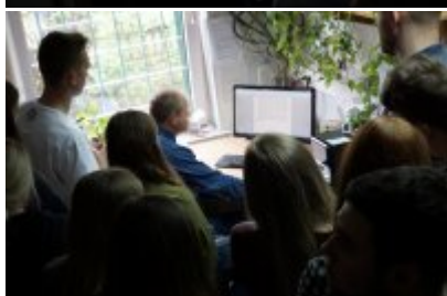
Studenci WSPol podczas wizyty w LK KWP w Olsztynie #3