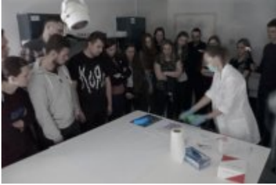
Studenci WSPol podczas wizyty w LK KWP w Olsztynie #22