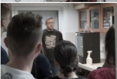
Studenci WSPol podczas wizyty w LK KWP w Olsztynie #16