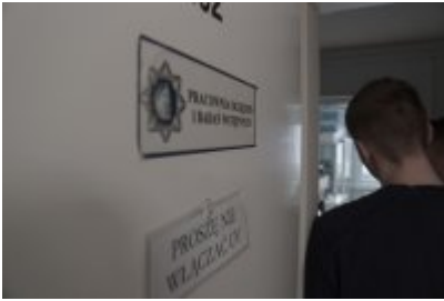
Studenci WSPol podczas wizyty w LK KWP w Olsztynie #23