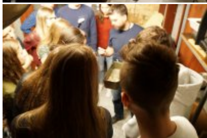
Studenci WSPol podczas wizyty w LK KWP w Olsztynie #27