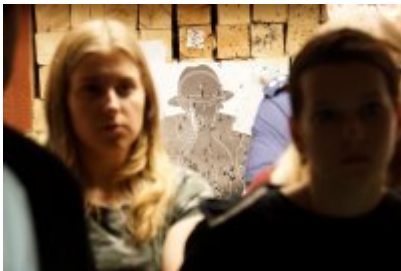
Studenci WSPol podczas wizyty w LK KWP w Olsztynie #25