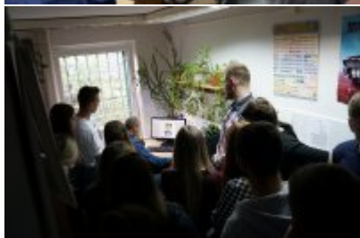
Studenci WSPol podczas wizyty w LK KWP w Olsztynie #2