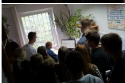
Studenci WSPol podczas wizyty w LK KWP w Olsztynie #4