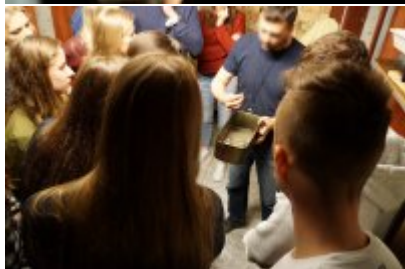
Studenci WSPol podczas wizyty w LK KWP w Olsztynie #26