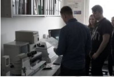
Studenci WSPol podczas wizyty w LK KWP w Olsztynie #11