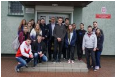
Studenci WSPol podczas wizyty w LK KWP w Olsztynie #6