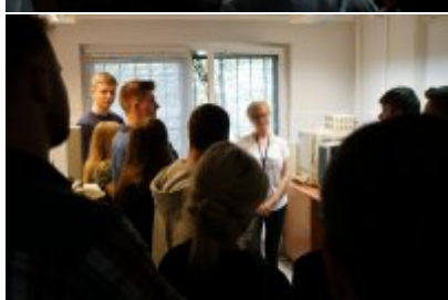
Studenci WSPol podczas wizyty w LK KWP w Olsztynie #5