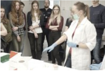
Studenci WSPol podczas wizyty w LK KWP w Olsztynie #20