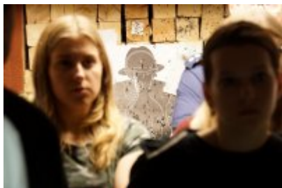
Studenci WSPol podczas wizyty w LK KWP w Olsztynie #25