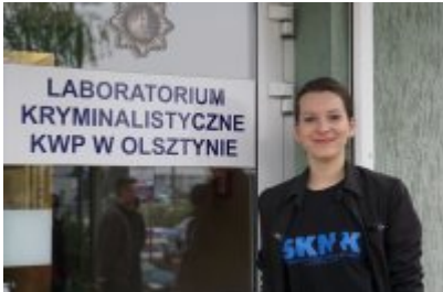
Studenci WSPol podczas wizyty w LK KWP w Olsztynie #7