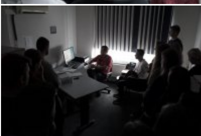
Studenci WSPol podczas wizyty w LK KWP w Olsztynie #17