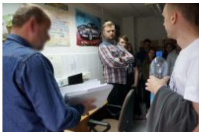
Studenci WSPol podczas wizyty w LK KWP w Olsztynie #1

pasjonaci kryminalistyki odwiedzili m.in. laboratoryjne pracownie daktyloskopii, biologiczną, badań chemicznych, badań broni i balistyki, a także badań wypadków drogowych. Podczas spotkań z biegłymi i specjalistami z zakresu tych dziedzin, studenci mogli poznać i zobaczyć z bliska podstawowe zadania z jakimi muszą się mierzyć pracownicy takiego laboratorium.