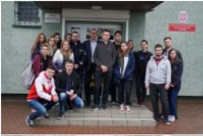
Studenci WSPol podczas wizyty w LK KWP w Olsztynie #6