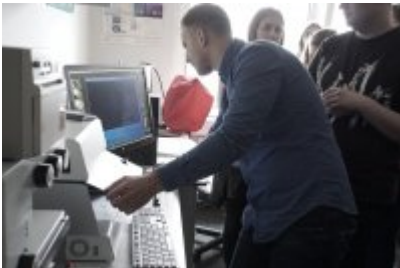
Studenci WSPol podczas wizyty w LK KWP w Olsztynie #13