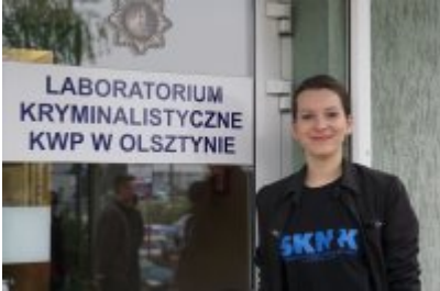
Studenci WSPol podczas wizyty w LK KWP w Olsztynie #7