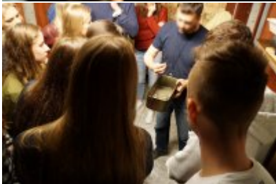
Studenci WSPol podczas wizyty w LK KWP w Olsztynie #26