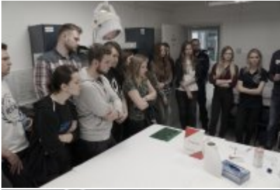
Studenci WSPol podczas wizyty w LK KWP w Olsztynie #21