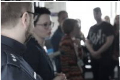
Studenci WSPol podczas wizyty w LK KWP w Olsztynie #14